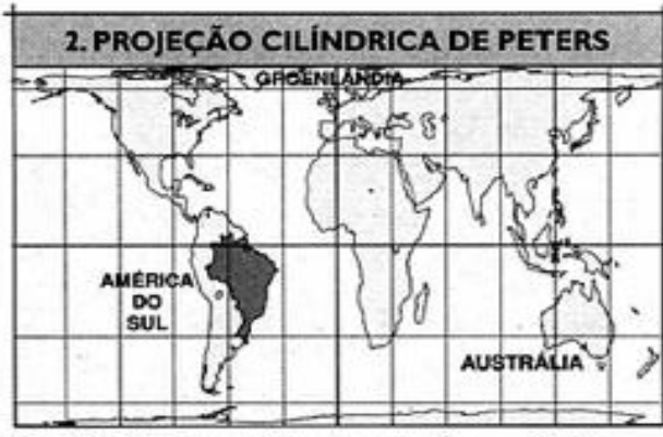
Fonte: OLIVEIRA, Célio de. Dicionário cartográfico. 59.900 km NO EQUADOR