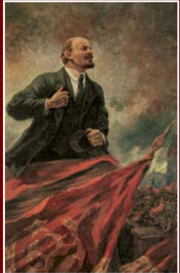
Lenin foi o primeiro chefe do governo socialista implantado na Rússia pela revolução de outubro de 1917.