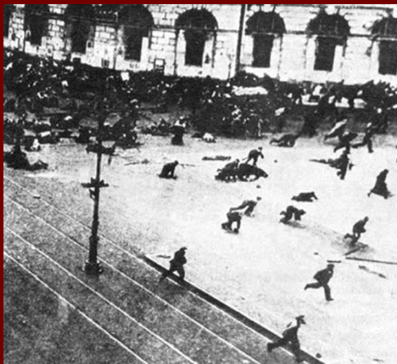
Domingo Sangrento - 1905

• Mencheviques e Bolcheviques X Part. Dem. Constitucional (cadete) – Burguesia liberal.